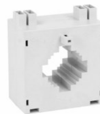
Przekładniki prądowe DM3T0250