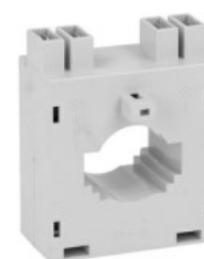
Przekładniki prądowe DM2T0400