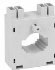
Przekładniki prądowe DM2T0300