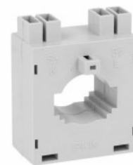
Przekładniki prądowe DM2T0250