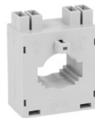
Przekładniki prądowe DM2T0100