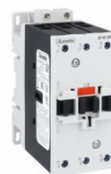
Stycznik mocy BF40